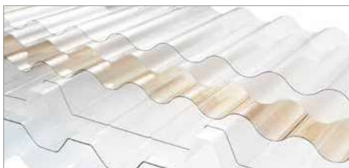
COMPATTO - Spessore 1 mm / GRECA 21, 28, 40