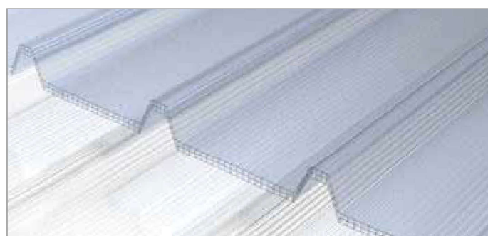
GRECA 40 - Sp. 10 o Sp. 12